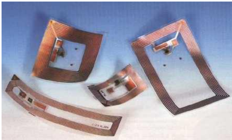
Ukážky RFID značiek s anténami vo vyhotovení, ktoré umožňuje nalepenie na sledované predmety