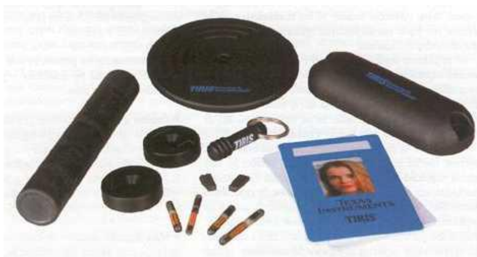
RFID značky viacerých vyhotovení, určené na nasadenie v bezpečnostných aplikáciách

Počiatky vývoja tejto technológie siahajú hlboko do druhej polovice minulého storočia. Aj preto sa natíska otázka, prečo si ju väčšina médií a aktivistov bojujúcich za ochranu súkromia začala intenzívnejšie všímať až v minulom roku. Otvorme teda spoločne dvere a nahliadnime na túto technológiu pekne zoširoka.