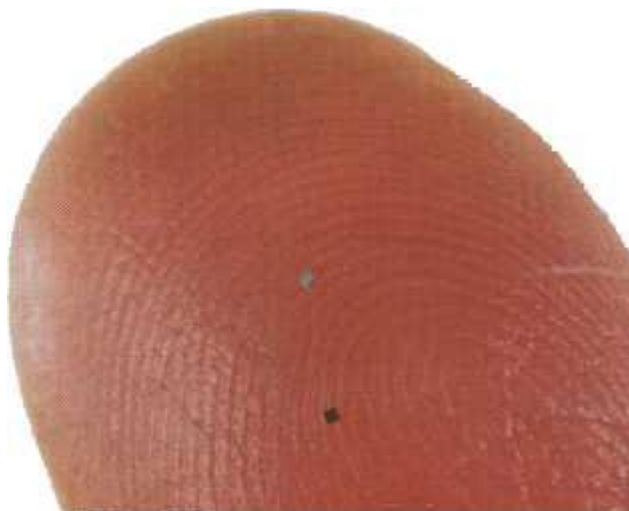
Aktuálne najmenšie čipy RFID z produkcie spoločnosti Hitachi majú aj napriek svojím rozmerom implementovanú anténu

Prvým, dnes už všeobecné rozšíreným a takmer samozrejým spôsobom identifikácie produktov všetkého druhu sa stali čiarové kódy. Patent na ne bol udelený pred viac ako päťdesiatimi rokmi - v roku 1952. Systém označovania čiarovými kódmi následne prechádzal štandardizáciou a jeho prvé využitie prišlo až v roku 1966. To však bol celý systém ešte len v plienkach a ako rok, v ktorom možno hovoriť o jeho reálnom využití, sa uvádza až rok 1984. Vtedy však čiarový kód na označovania používalo iba 15-tisíc firiem. Prelomové boli nasledujúce roky. Už o tri roky neskôr čiarový kód využívalo 75-tisíc spoločností a dnes budete iba ťažko hľadať tovar, na ktorom by toto označenie chýbalo.