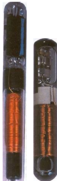
RFID značky vo vyhotovení, ktoré umožňuje implantáciu pod kožu

Za základ systému RFID možno považovať čítacie zariadenia. To je v závislosti od konkrétnej aplikácie buď stacionárne, alebo mobilné. Čítacie zariadenia plnia v systéme RFID dve úlohy. Prvou je vysielanie vysokofrekvenčného signálu, druhou príjem identifikátorov zo značiek RFID.